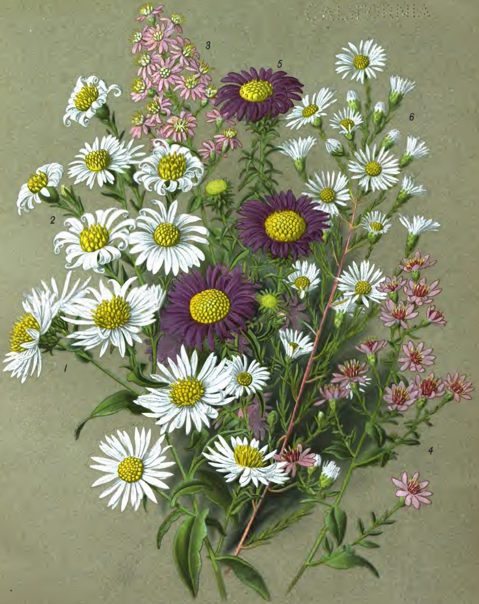
Aster Novi-Belgii var. candidissima (1-2); A. cordifolius (3) и ея разновидность major (4); A. grandiflorus (5) и A. Datchii (6).

Възрѣвшая разновидность Ново-бельгійской астры;